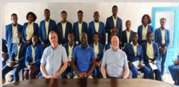
CENTRE POLYTECHNIQUE Du CENTRE