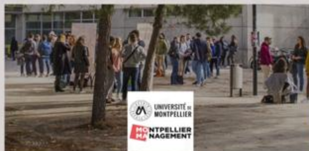
UNIVERSITE DE MONTPELLIER

LE CYCLE DE FORMATION MASTER AU CPC DE YAMOOUSSOUKRO EN PARTENARIAT AVEC L'UNIVERSITE DE MONTPELLIER (FRANCE), MONTPELLIER MANAGEMENT (MOMA)